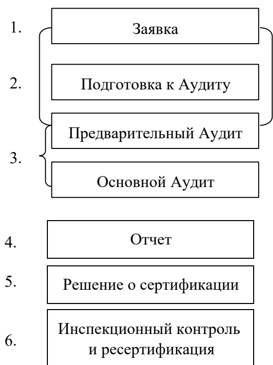
Схема 4.1 Процесс сертификации

1,2) процессы, связанные с субъектом лесной сертификации;